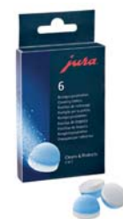
2-fázisú tisztítótabletta 6 alkalomra elegendő

A JURA kávéfőzőgépek számára is fontos a napi karbantartás. Ez biztosítja ugyanis, hogy Ön mindig a lehető legjobb minőségű kávéét élvezhesse. A JURA integrált karbantartási programjainak és tisztítószerének segítségével a karbantartási műveletek mind egy gombnyomással, az egységek kézi eltávolítása nélkül, kényelmesen elvégezhetők. Készülékeink megfelelnek a legszigorúbb higiéniai előírásoknak is. Ezt a független német testintézet, a TÜV Rheinland®, is tanúsítja.