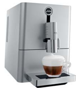
ENA Micro 9

Az ENA Micro készülékek szíve, az egyedülálló egycsészes Micro-főzőegység, amelynek hála a JURA képes volt egy addig soha nem látott méretű kompakt fullautomata kávéfőző megalkotására. Az Micro-sorozat gépei a legkisebb konyhába is könnyűszerrel elhelyezhetők, miközben a kávéfőzés terén nem ismernek kompromisszumot.