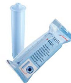
CLARIS Blue 1 db szűrőfilter