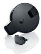
Wi-Fi kiegészítő szett Cool Control-hoz 0,6 literes verzióhoz 1,0 literes verzióhoz