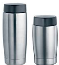
Rozsdamentes acélból készült vákuumos tejtartály 0,6 literes 0,4 literes