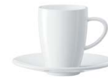
Hosszú kávé csésze 2 db-os és 6 db-os szett