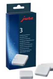
Vízkötelenítő tabletták 3 alkalomra elegendő