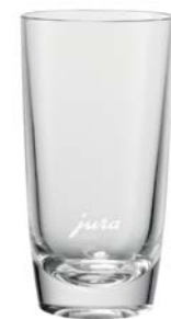
Latte Macchiato pohár Úrtartalom kb. 270 ml, kb. 14 cm magas, 2 db-os szett