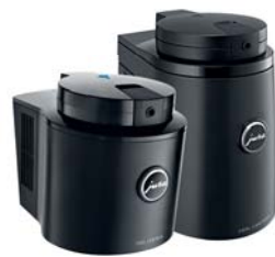
Cool Control Wi-Fi 0,6 literes, fekete 1,0 literes, fekete