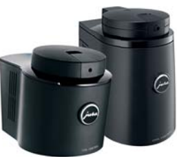
Cool Control Basic 0,6 literes, fekete 1,0 literes, fekete