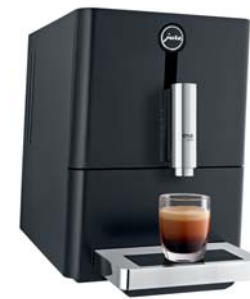
ENA Micro 1