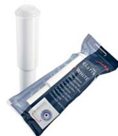
CLARIS White 1 db szűrőfilter